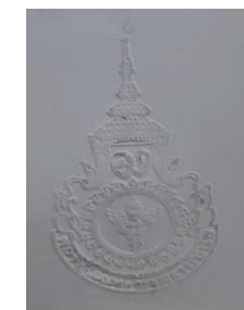
ตราสถาบัน นูน (ขาว)